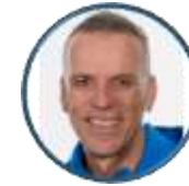
Wolfgang Pohl Präsident DSLV