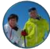
Rosi Mittermaier & Christian Neureuther ehemalige Skirennläufer

Wintersportstars Rosi Mittermaier & Christian Neureuther: "Wintersport – Mit ABSTAND mein Lieblingssport"