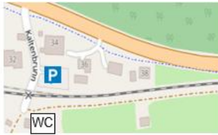
Zufahrt über Bahnschranke